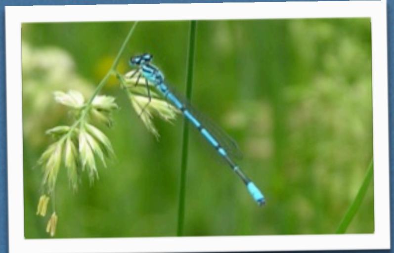
Die Hufeisen-Azurjungfer und ...

Egal, ob Sie einen Teich hinter dem Haus oder in der Kleingartenanlage haben, am Stadtrand oder mitten in der City - oder auch nur einen bepflanzten Wasserkübel auf dem Balkon oder der Terrasse. Mit wenig Aufwand können Sie mit Ihrem Gartenteich die Untersuchung unterstützen! Dabei können Sie die Tiere an Ihrem Teich kennenlernen und viele spannende Entdeckungen machen.