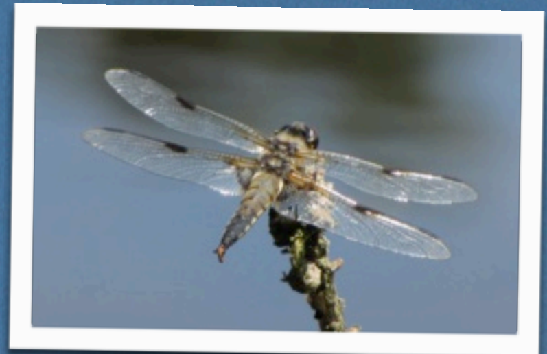
... der Vierfleck fliegen an vielen Gartenteichen

Leuchtend rote Heidelibellen trifft man ebenfalls oft im Garten an